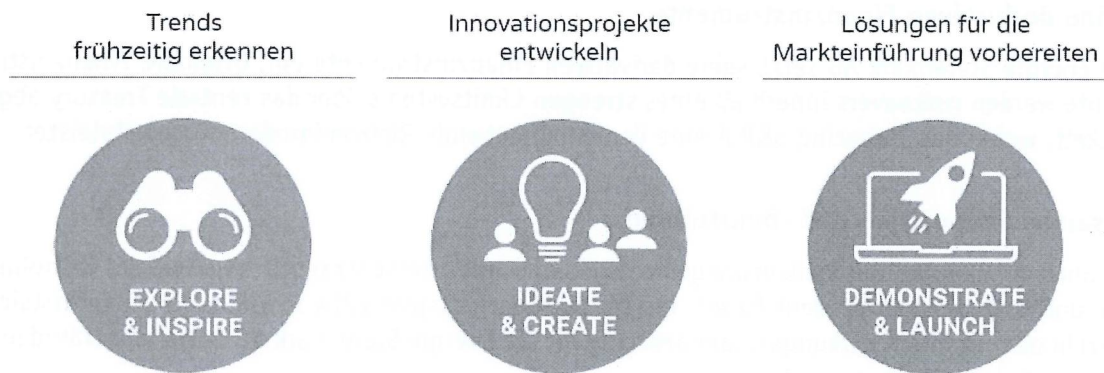
Abb.: „Green Energy Lab“ – die Phasen im Open Innovation Prozess