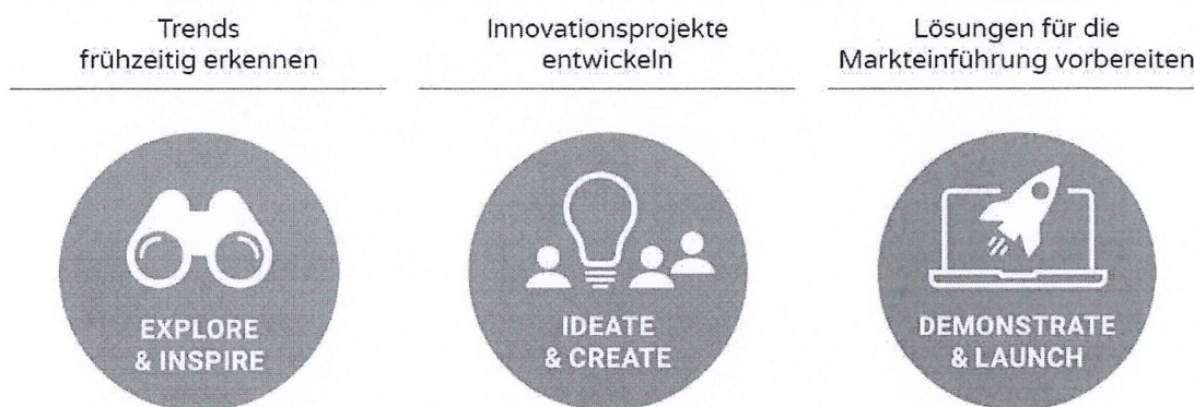
Abb.: „Green Energy Lab“ – die Phasen im Open Innovation Prozess

Darüber hinaus hat sich das GEL mittels kundenorientierter Leistungspakete als relevanter Player in der F&E-Community und an der Schnittstelle hin zu öffentlichen Organisationen etabliert. Im Jahr 2024 verliefen auch die umfangreichen Vorbereitungen auf das Thema „Wärmewende“ inkl. Start des Bewerbungsprozesses als „Innovationslabor für die Wärmewende“.